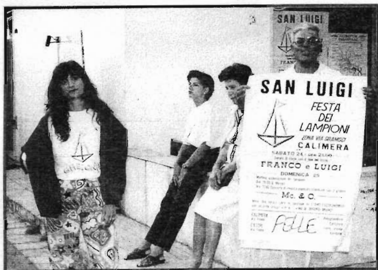
FESTA DEI LAMPIONI: UNA TRADIZIONE DA SALVAGUARDARE

È questo un appuntamento atteso con curiosità da gran parte dei cittadini, ed è per questo, che invitiamo tutti e soprattutto i giovani a partecipare alla sua stesura , inviando un proprio contributo (scritti, poesie, storielle paesane, foto curiose e d'epoca, vignette, materiale vario, ecc.) alla Redazione del giornale.