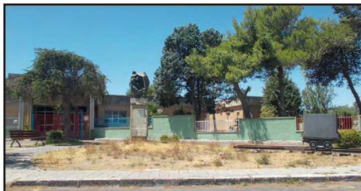
Piazza del Minatore