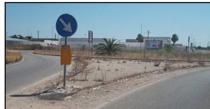
Zona Attività Produttive