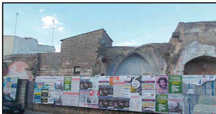
Via Salvo d'Acquisto