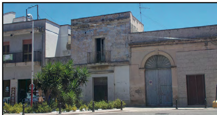
Piazza del Sole