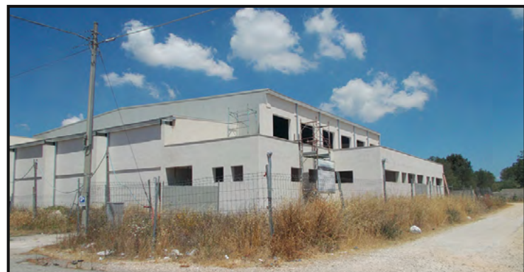
Palazzetto dello Sport