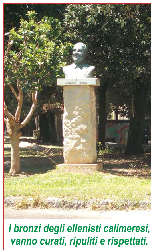
I bronzi degli ellenisti calimeresi, vanno curati, ripuliti e rispettati.

In conclusione nu bellu listone fattu de soci e soce vagnone ca sannu già tuttu sorte mia ca cu governi nci vole puru fatia!