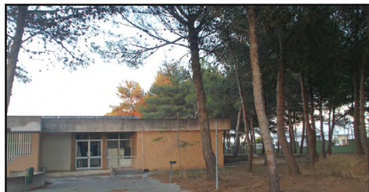
Scuola Materna Comunale